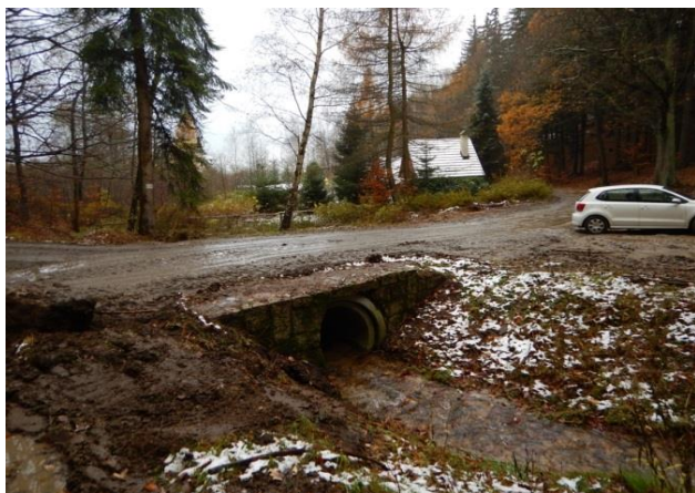
Propustek pod lesní cestou

Ohrožení přítokem ze svažitých lesů. Drobný tok směřuje přes rozptýlenou zástavbu do zřejmě nekapacitní propustku pod silnicí. Je vhodné zvážit výstavbu retenční přehrážky.