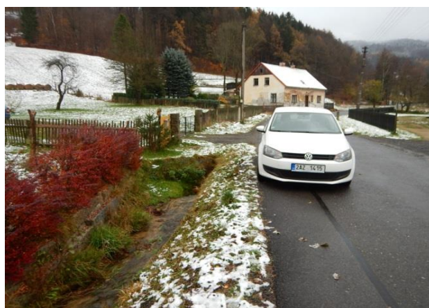
Propustek pod silnicí